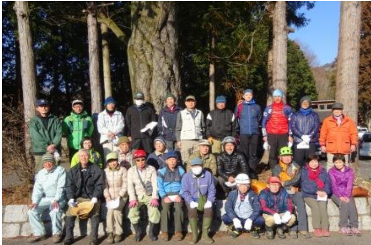
参加者 31 名の集合写真