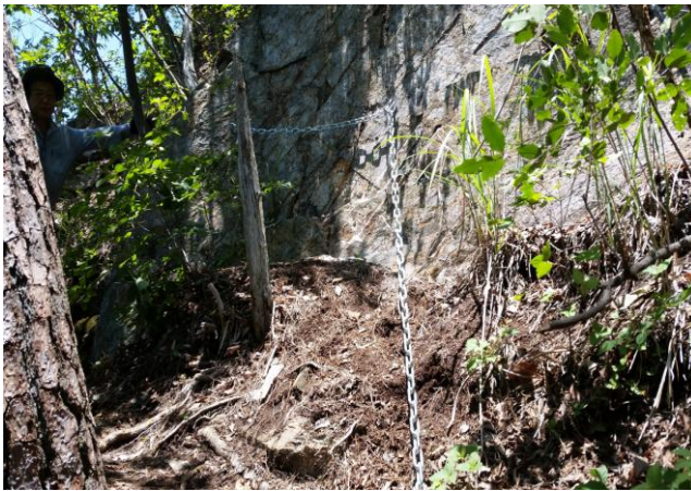
腰掛岩手前の岩場

従来、P444と呼んでいた山は、地元岩崎の関係者の話から鳥屋山と判明した。これまで北側岩場には松の木の根元にトラロープが垂れていたが安全な鎖を設置した。