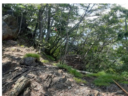
馬蹄形コース入口

市長宛の届出書、申請書の提出の手順。地主の同意書に地番が必須条件となる。地形図(30000分の1, 18000の1、4500の1), 構造図、見取り図、立体図、設置個所の写真、修景図、意匠配色図を添付し市みどりのまちづくり課に提出し許認可を得る。